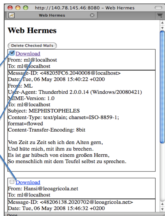
Figure 2) Mail Page